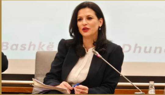
Znj. Etilda Gjonaj

Deputete në Kuvendin e Shqipërisë, Raportuese e Përgjithshme për dhunën ndaj grave në Këshillin e Evropës